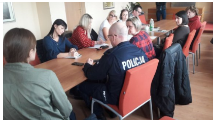
policjanci z przedstawicielami szkół rozmawiają na temat bezpieczeństwa