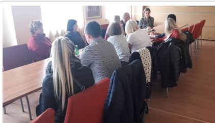
policjanci omawiają funkcjonowanie Krajowej Mapy Zagrożenia Bezpieczeństwa