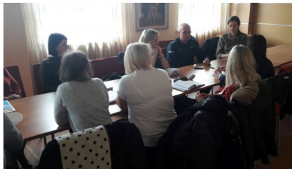
spotkanie w Urzędzie Miasta i Gminy w Koluśkach